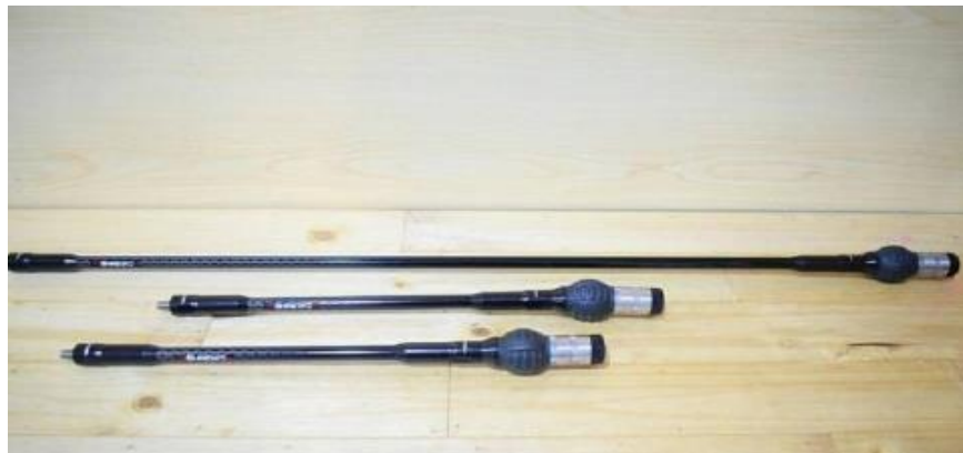
Gambar 2.9 Stabilizer

selaku keseimbangan sebab stabilizer memiliki bagian pendek yang terpasang ke arah samping kanan serta kiri hingga dari itu busur dapat mempunyai penyeimbang yang bagus.