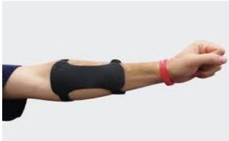
Gambar 2.7 Arm Guard

Bahan buat pelindung lengan dibuat dari kombinasi plastik yang elastis sehingga gampang di wujud. Pelindung lengan. Pelindung lengan berperan melindungi lengan dari gesekan tali string ke lengan pada dikala membebaskan anak panah, sehingga pemanah tidak merasa kesakitan kala terserang gesekan dari string .