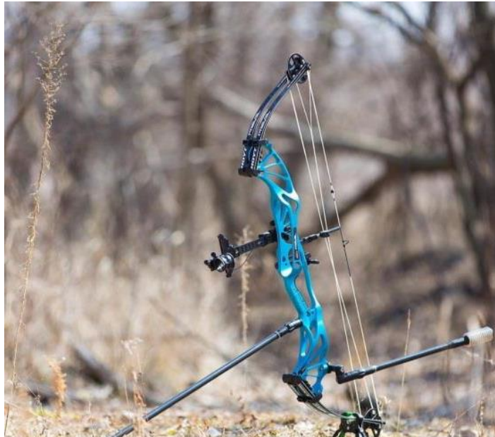
Gambar 2.4 Busur Compound

Komponen-komponen pada busur yang dinyatakan oleh Prasetyo(2014:82) antara lain yaitu sebagai berikut: