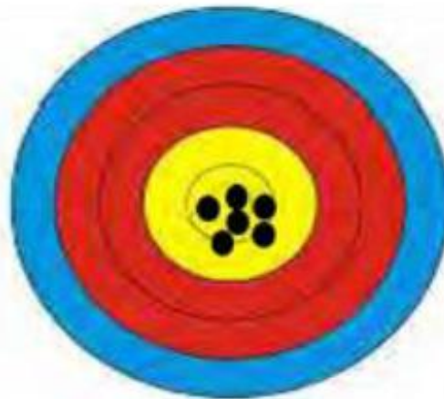
Gambar 2.11 Gambar Akurasi Memanah

Akurasi dalam memanah bertujuan utama dalam berolahraga panahan yang wajib dapat dicapai oleh seseorang atlet (Rivalsha, 2018:23). Bila seseorang atlet panahan tidak memiliki akurasi tembakan yang baik, hingga atlet tersebut hendak kesusahan buat jadi juara kala menjajaki pertandingan serta atlet wajib memahami serta menguasai ke akurasi tembakan (Selian & Irwansyah, 2018). Dalam berolahraga panahan, atlet tidak dituntut buat melaksanakan metode yang sempurna. Tetapi, seseorang atlet panahan sangat dituntut buat mempunyai akurasi tembakan yang baik serta didukung keajegan metode memanah. Dalam berolahraga panahan metode memanah tidak dibatasi wajib cocok dengan ketentuan, mereka leluasa memakai metode apa saja asalkan tidak mengusik pemanah lain dikala pertandingan, hendak namun apabila metode memanah baik serta ajeg hendak menciptakan tembakan yang baik sehingga kala seorang memandang metode (Prasetyo, 2014:18). Bersumber pada definisi diatas yang sudah dirangkum hingga bisa disimpulkan akurasi dalam berolahraga panahan merupakan tingkatan keakraban perkenaan anak panah hasil tembakan dari pemanah ke titik X dalam sasaran yang bercorak kuning (nilai 10).