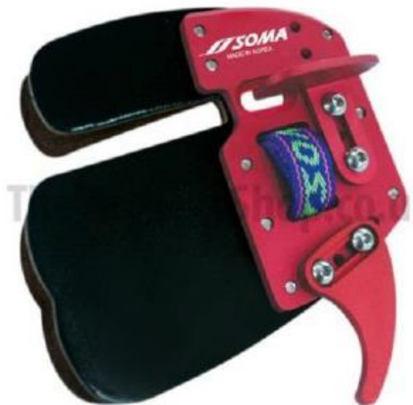
Gambar 2.6 Finger Tab

Pelindung jari berperan melindungi jari khususnya 3 jari penarik ialah jari telunjuk, jari tengah, serta jari manis (Prasetyo, 2014: 28). Pelindung jari ini digunakan untuk pemanah yang memakai busur tradisional, nasional, serta standart bow buat kurangi rasa sakit kala menarik string. Pelindung jari umumnya dibuat dari bahan kulit biar elastis dikala digunakan, tidak hanya itu agak tahan lama kala digunakan secara selalu.