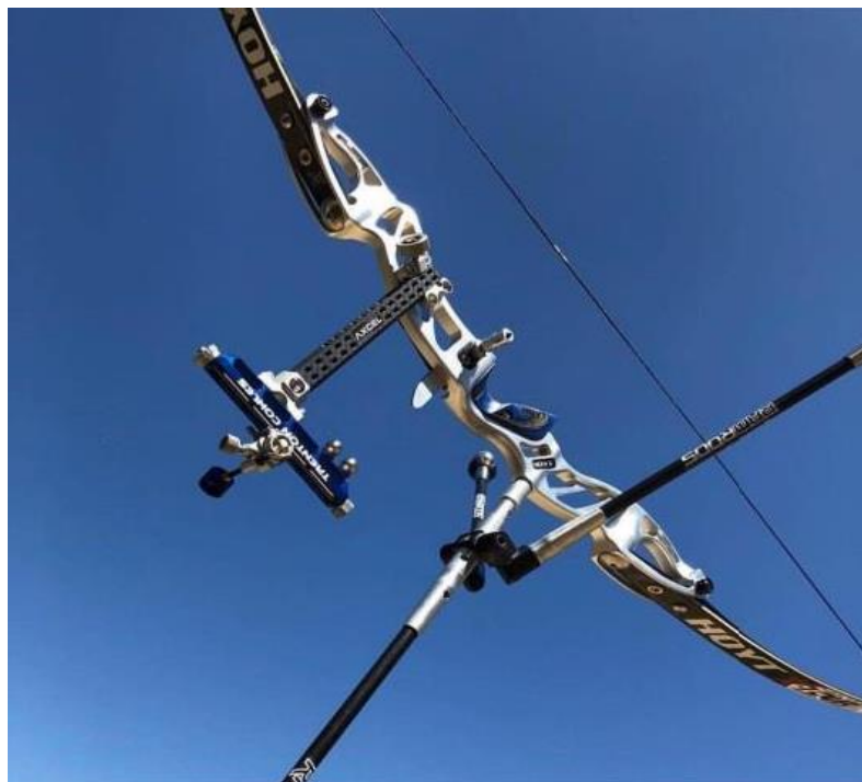
Gambar 2.3 Busur Recurve