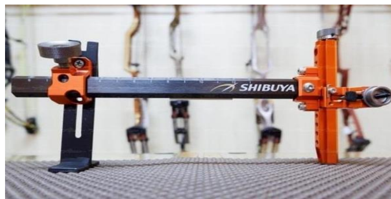
Gambar 2.8 Sight (Fisir)

Pemakaian perlengkapan pembidik/ sight sangat berarti sebab dalam perlombaan panahan jarak yang digunakan berbeda- beda jadi guna dari sight merupakan apabila berpindah jarak bisa mengganti dimensi sight biar dikala dibidik ke kuning anak panah pula hendak menimpa kuning.