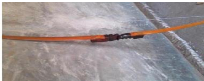
Gambar 2.1 Busur Tradisional

Yang ketiga merupakan busur tradisional. Busur tersebut merupakan khas gaya Mataram Yogyakarta yang membuatnya berbeda dengan olahraga panahan modern adalah bentuk busur panah atau biasa disebut dengan gendowo-nya yang sangat sederhana, terbuat dari kayu dan bambu. Selain itu, para pemainnya harus mengenakan busana tradisional, yakni kebaya jarit untuk wanita serta blangkon dan surjan untuk pria dan duduk bersila ketika menembakkan panah ke sasaran. Dan yang keempat merupakan busur nasional. Busur ini berbahan kayu dan limbsnya berbahan kayu berlapis fiberglass . Dalam kompetisi panahan Indonesia, " standard bow " ini boleh mengikuti ronde nasional dan ronde recurve . Jadi " standard bow " pun masuknya ke ronde recurve . Di bawah ini adalah gambar busur yaitu: