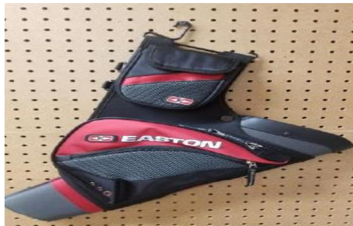
Gambar 2.10 Slide Quiver

Kantong anak panah berperan selaku tempat anak panah yang terpasang di bagian pinggul sebelah kanan, tidak hanya buat tempat anak panah side quiver pula berperan buat mempermudah pemanah mengambil anak panahnya tanpa wajib melaksanakan gerakan yang lebih banyak dibandingkan meletakan anak panah di tanah.