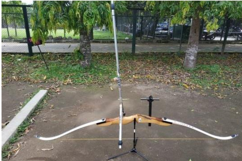
Gambar 2.2 Busur Nasional