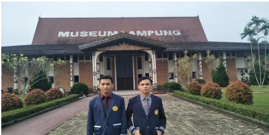
Gambar 1.1 Gedung Pameran UPTD Museum Negeri Provinsi Lampung

PKL dilaksanakan di instansi UPTD Museum Negeri Provinsi Lampung yang beralamat di Jalan ZA Pagar Alam No.64 Bandar Lampung. Gedung pameran UPTD Museum Negeri Provinsi Lampung dapat dilihat pada gambar 1.1 berikut ini.