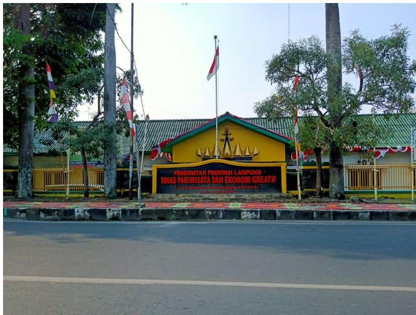
Gambar 1.2 Lokasi Dinas Pariwisata dan Ekonomi Kreatif