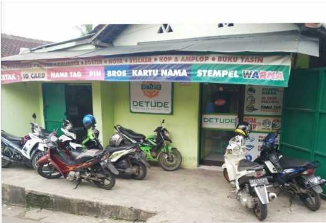
Gambar 1.2 Percetakan Detude