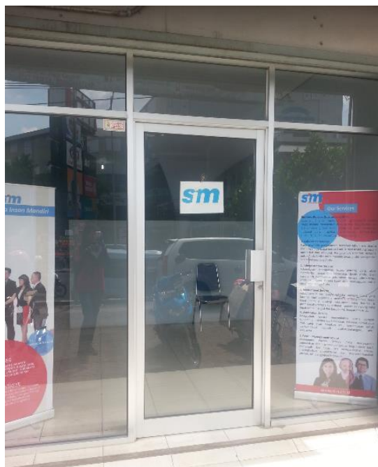
Gambar 1.2 Gedung PT Swakarya Insan Mandiri Bandar Lampung.

Letak perusahaan berada di posisi yang strategis dan berada pada lingkungan yang ramai. Adapun bentuk gedung PT Swakarya Insan Mandiri Cabang Bandar Lampung pada Gambar 1.2 sebagai berikut :