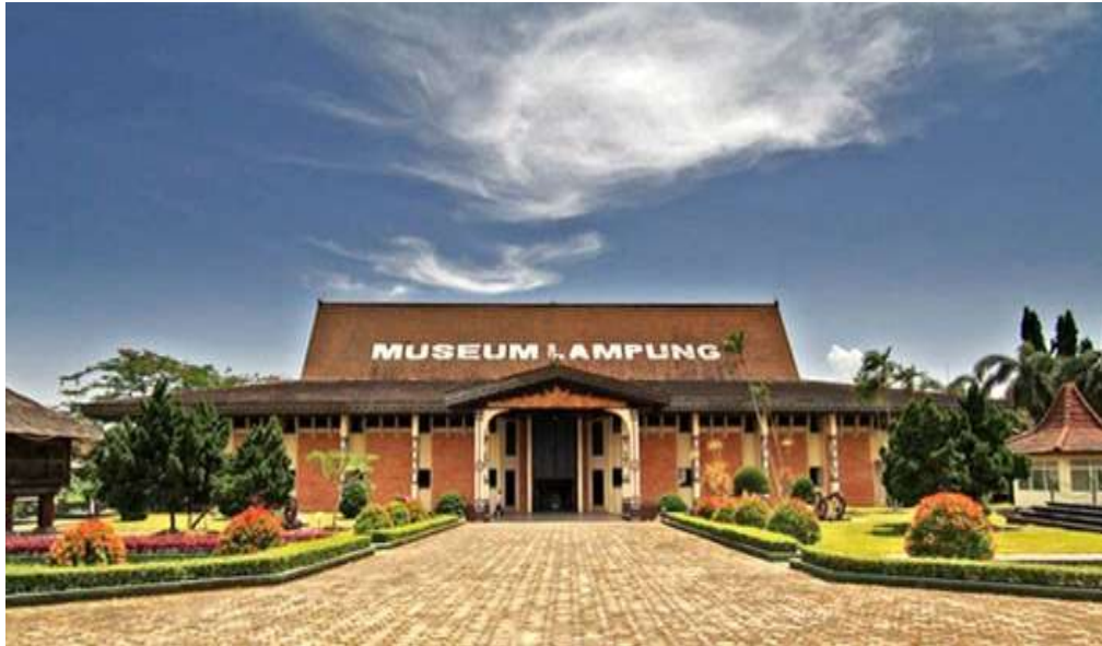
Gambar 1.1 Gedung Pameran UPTD Museum Negeri Provinsi Lampung

Jarak tempuh 2,3 Km dan waktu tempuh 5 Menit dari Universitas Teknokrat Indonesia (UTI) ke UPTD Museum Negeri Provinsi Lampung. Ilustrasi jarak dan waktu tempuh dapat dilihat pada gambar 1.2