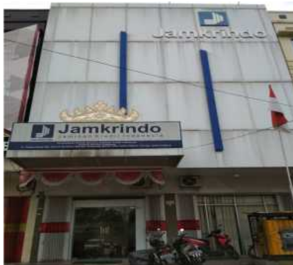
Gambar 1.1 Gedung Perum Jamkrindo Bandar Lampung

Pelaksanaan Praktik Kerja Lapangan (PKL) di Perum Jamkrindo Kantor Cabang Bandar Lampung yang berlokasi di Jalan Teuku Umar Nomor 10 E-F Kedaton Bandar Lampung 35141. Adapun bentuk gedung Perum Jamkrindo Cabang Bandar Lampung pada Gambar 1.1 sebagai berikut :