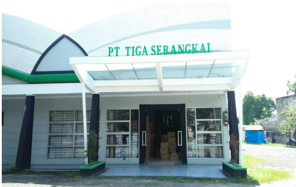
Gambar 1.1 PT Tiga Serangkai International, Kanwil Bandar Lampung ( 2018 )

PT Tiga Serangkai International Bandar Lampung adalah sebuah perusahaan di Kota Bandar Lampung yang bergerak dibidang penjualan buku. Yang beralamat di Jalan Sultan Agung No.44, Kel Sepang Raya, Kec Labuhan Ratu, Bandar Lampung, Lampung Indonesia (0721), website: www.tigaserangkai.com . Berikut Gambar 1.1 merupakan tampak depan kantor :