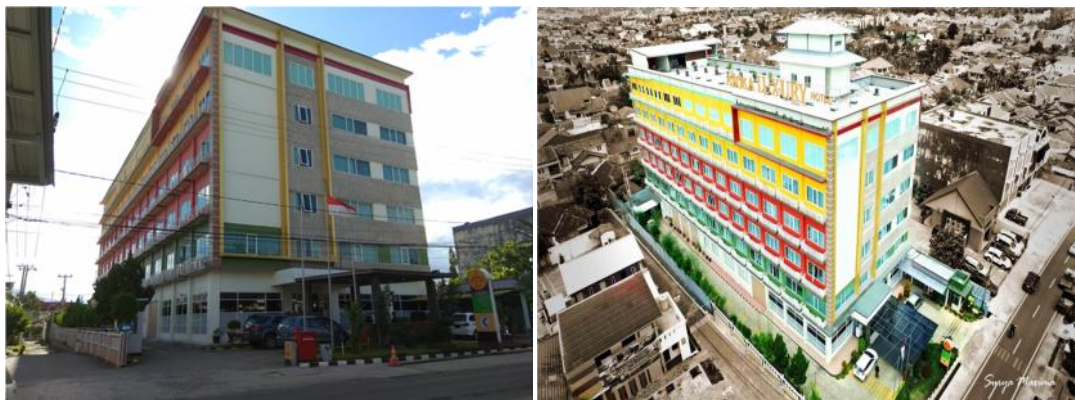
Gambar 1.1 Asoka Luxury Hotel Lampung

Pelaksanaan PKL bertempat di Asoka Luxury Hotel Bandar Lampung yang beralamat di Jl. Pulau Morotai No.16D, Bandar Lampung. Adapun denah lokasi Asoka Luxury Hotel Bandar Lampung adalah sebagai berikut: