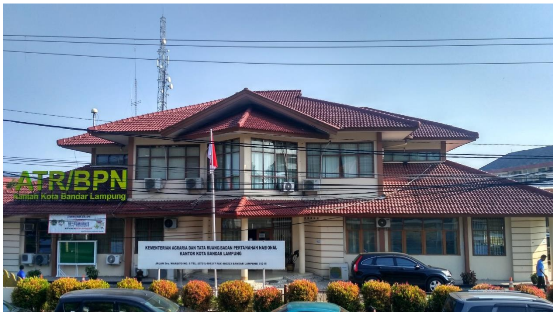
Gambar 1. 2 Kementerian Agraria dan Tata Ruang/Badan Pertanahan Nasional Kantor Pertanahan Kota Bandar Lampung