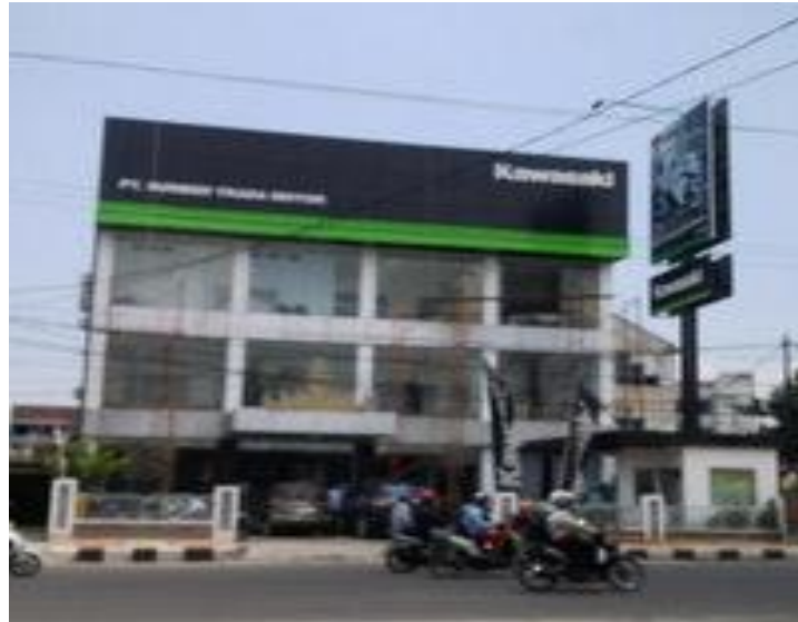
Gambar 1.1 Kantor PT Sumber Trada Motor Bandar Lampung

Denah lokasi atau letak dari suatu tempat. Dibawah ini merupakan denah dan jarak tempuh dari Universitas Teknokrat Indonesia ke lokasi Kantor PT Sumber Trada Motor no 44, Gotong Royong, Tanjung Karang Pusat, Kota Bandar Lampung, Lampung. Berdasarkan sumber yang tertera, jarak tempuh tercepat untuk ke lokasi Kantor PT Sumber Trada Motor membutuhkan waktu sekitar 30 menit dari Universitas Telnokrat Indonesia.