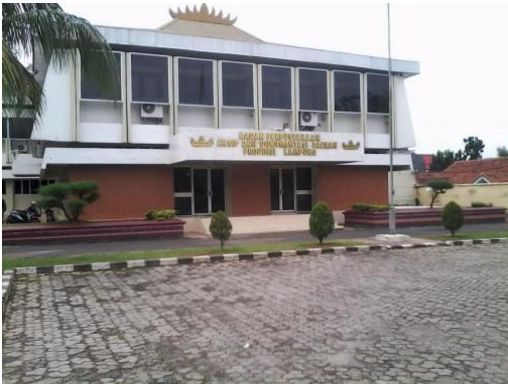
Gambar 1.2 Gedung Halaman Depan Kantor Dinas Perpustakaan dan Kearsipan Provinsi Lampung