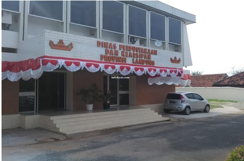
Gambar 1.1 Gedung Kantor Dinas Perpustakaan dan Kearsipan Provinsi Lampung