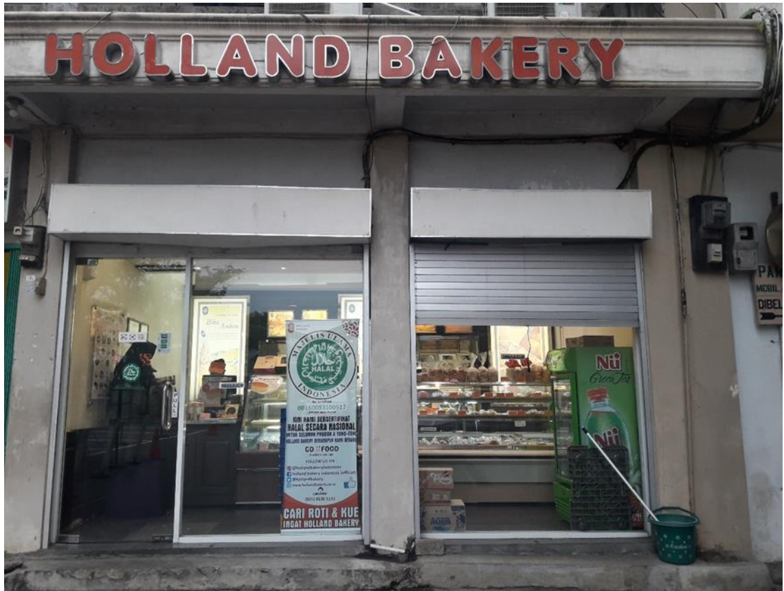
Gambar 1.2 PT. Mahkota Pangan Citra Rasa (Holland Bakery) Cabang RS. Urip Sumoharjo

Tampilan depan toko Holland Bakery Cabang RS.Urip Sumoharjo dapat dilihat pada Gambar 1.2 berikut ini :