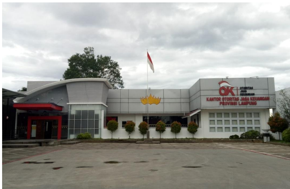
Gambar 1.2 Kantor Otoritas Jasa Keuangan (OJK) Provinsi Lampung

Halaman depan Kantor Otoritas Jasa Keuangan (OJK) Provinsi Lampung ditampilkan pada gambar 1.2.