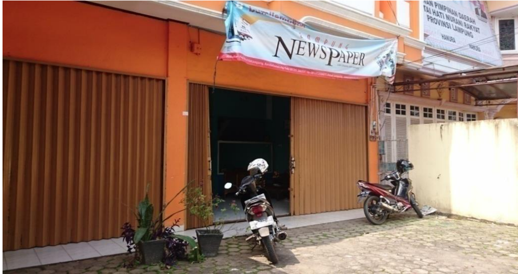
Gambar 1.1 Kantor Lampung Newspaper

yang ada di Lampung. Lampung News Paper merupakan bagian dari Radar Lampung/Radar Lampung Group.