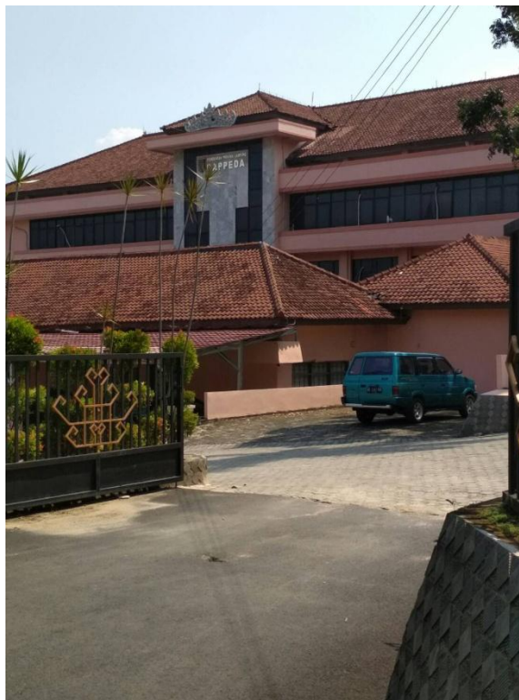
Gambar 1. 1 Navigasi Lokasi PKL dengan Universitas Teknokrat Indonesia