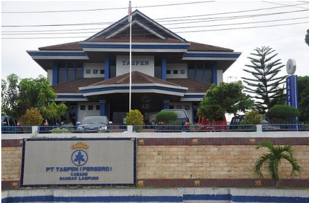
Gambar 1.1 Kantor Pt TASPEN ( persero )