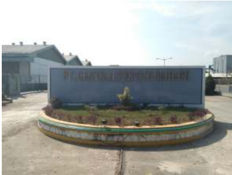
Gambar 1.1 PT.Central Pertiwi Bahari

Tempat Praktek kerja lapanga (PKL) berada di PT Central Pertiwi Bahari yang berada di jalan Ir. Sutami Km 16 Desa Sindang Sari, Kecamatan Bintang, Kabupaten Lampung Selatan. Penulis di tempatkan pada bagian Produksi sebagai Operator yang memantau jalannya mesin produksi bahan setengah jadi. Halaman depan kantor PT Central Pertiwi Bahari ditampilkan pada gambar 1.1.