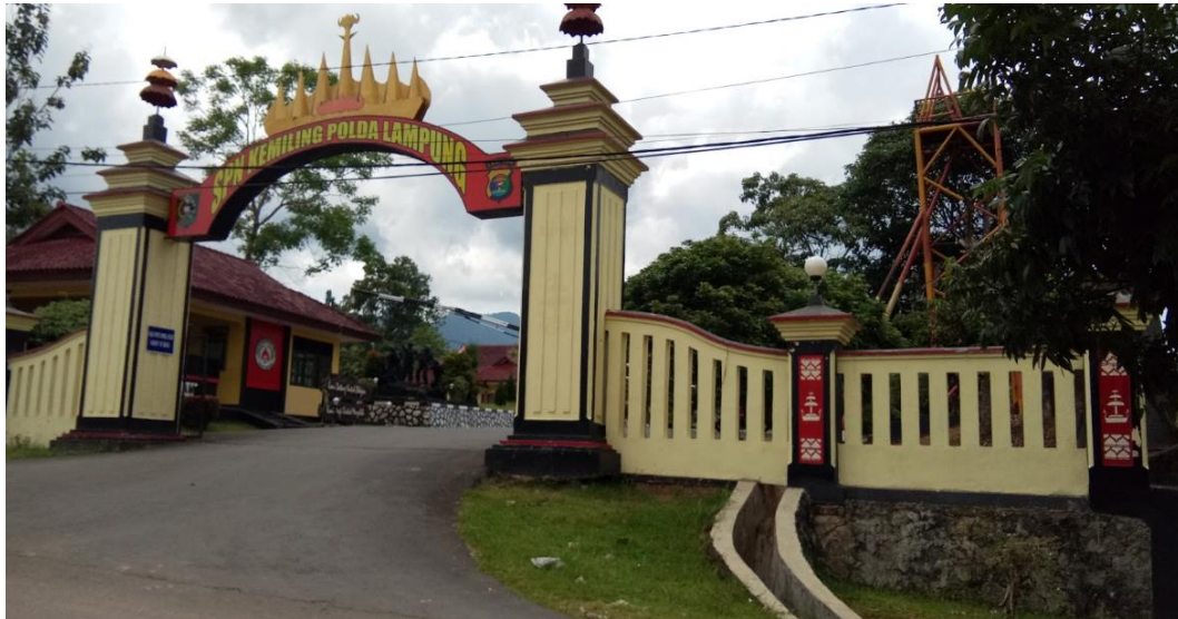
Gambar 1.1 Sekolah Polisi Negara Polda Lampung

Sekolah Polisi Negara Polda Lampung berdiri pada tahun 2003 yang terletak dikaki Gunung Betung yang memiliki luas area 200.000 M2 yang beralamat Jalan Untung Suropati No.1 Kelurahan Beringin Raya Kecamatan Kemiling Kota Bandar Lampung.