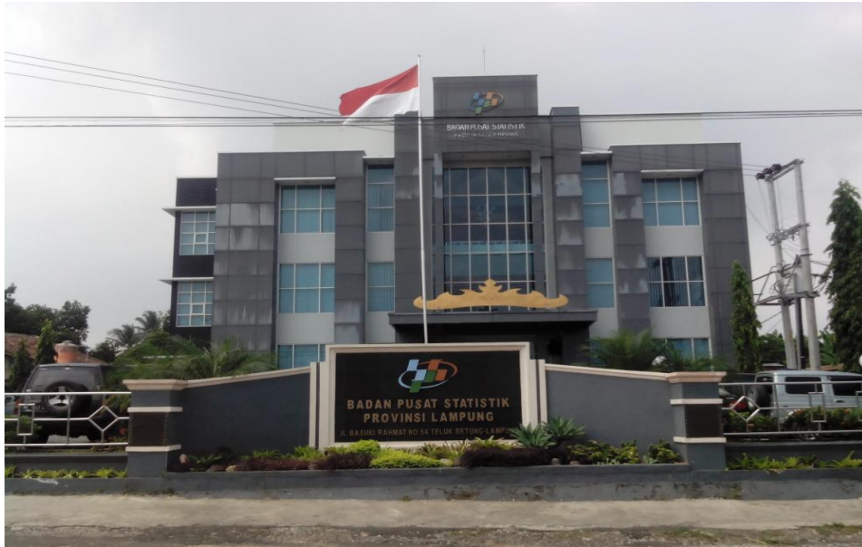
Gambar 1.2 Foto kantor BPS Provinsi Lampung

Berikut merupakan foto bagian depan kantor BPS Provinsi Lampung.