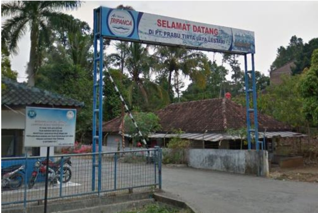
Gambar 1.2. Tampak Depan PT. Prabutirta Jaya Lestari